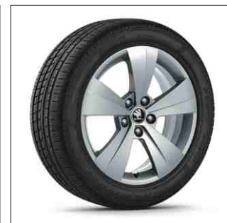
Jantă aliaj ŠKODA Helios

Prețurile din acest pliant sunt recomandate și conțin TVA. Oferta este valabilă până la 28.02.2017 și nu se cumulează cu alte oferte actuale. Fabricantul își rezervă dreptul de a modifica produsele și prețurile fără o notificare prealabilă. Pentru gama completă de roți și anvelope vă rugăm să vă adresați distribuitorului dumneavoastră autorizat. Imaginile sunt cu titlu informativ.